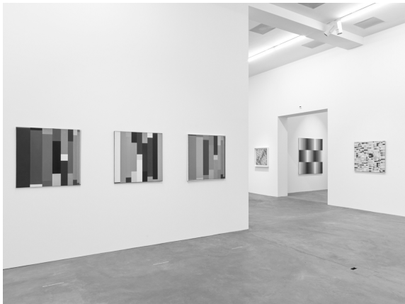
Ausstellungsansicht, Museum Haus Konstruktiv, 2026, Foto: Stefan Altenburger © Richard Paul Lohse-Stiftung / 2026, ProLitteris, Zürich

Werke der modularen Ordnung basieren auf der systematischen Manipulation eines Grundmoduls – etwa durch Drehung, Vervielfachung oder Vergrösserung.