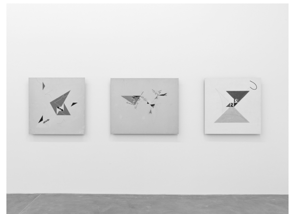
Ausstellungsansicht, Museum Haus Konstruktiv, 2026, Foto: Stefan Altenburger © Richard Paul Lohse-Stiftung / 2026, ProLitteris, Zürich

Diese frühen Zeichnungen, von denen wir eine Auswahl in Vitrinen präsentieren, bilden die konzeptuelle Grundlage seines Werks. Ausgeführt wurden die meisten Gemälde jedoch erst nach 1960, bedingt durch seine umfangreiche berufliche Tätigkeit. Die zeitliche Distanz zwischen Konzeption und Ausführung ist durch eine Doppeldatierung dokumentiert; gelegentlich findet sich eine dritte Zahl, die auf die Anzahl der Variationen verweist, die auf demselben mathematischen System basieren.