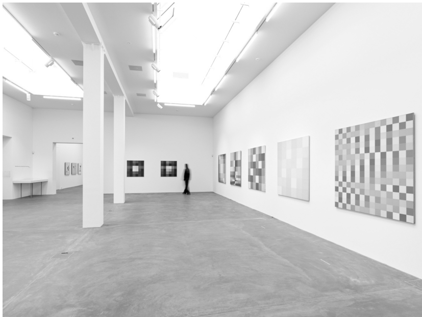
Ausstellungsansicht, Museum Haus Konstruktiv, 2026, Foto: Stefan Altenburger © Richard Paul Lohse-Stiftung / 2026, ProLitteris, Zürich

In beiden Schaffensfeldern, in der Gebrauchsgrafik wie in der freien Kunst, verfolgte er konsequent den Anspruch, ästhetische Form mit gesellschaftlicher Verantwortung zu verbinden – ganz im Sinne seiner Überzeugung, dass Ästhetik ohne soziale Verankerung nicht denkbar sei. Vor diesem Hintergrund überrascht es nicht, dass sich Lohse auch politisch und kulturpolitisch engagierte. Er initiierte und organisierte zahlreiche Ausstellungen im In- und Ausland, war Gründungsmitglied der Allianz – Vereinigung moderner Schweizer Künstler und unterstützte aktiv die antifaschistische Bewegung in Deutschland, Frankreich und Italien. Er wandte sich mit Appellen an Entscheidungsträger im Kulturbereich und setzte sich öffentlichkeitswirksam sowohl für die Anerkennung der konstruktiv-konkreten Kunst als auch für die Förderung ausgewählter Künstlerinnen und Künstler ein.