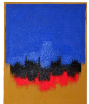
Wir zeigen moderne Kunst im Museum.

Anmeldung bis spätestens 3 Tage vor dem Termin