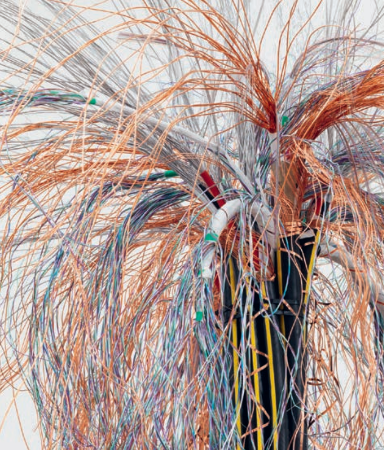
Vanessa Billy Large Burst II, 2019