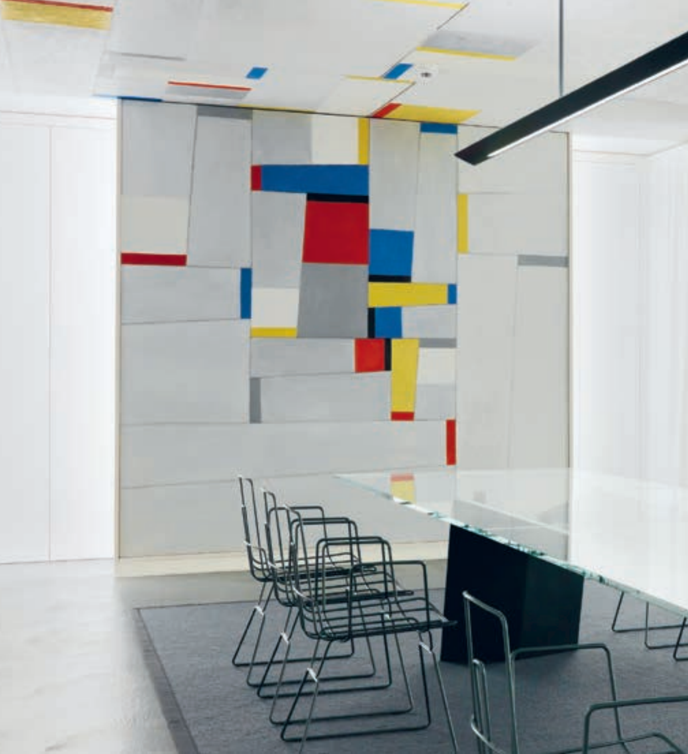
Fritz Glamer Rockereller Dining Room, 1963/1964

Konstruktives am Puls der Zeit Geschichte, die lebt. Kunst, die weiterdenkt. Die Ausstellungen im Haus Konstruktiv führen das kunsthistorische Erbe in die Gegenwart. Tradition trifft auf Innovation. Zeitgenössische Konzepte spiegeln sich in den Werken der Vergangenheit wider. Altes neu denken. Neues verankern.